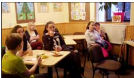
Pokračování z předchozí strany